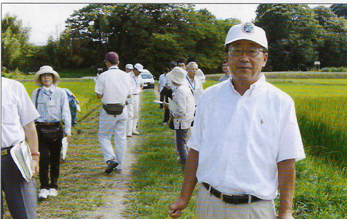
7年間、毎年続けてきた農業改革、現地視察