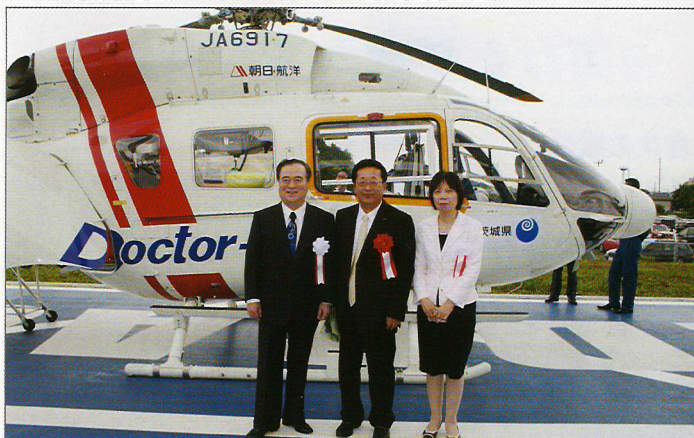
ドクターヘリ 橋本知事、山口副知事とともに

農業、石材業の振興、企業誘致等の雇用創出等、16年間思いを訴え続けて参りました。これからも、今まで以上、110%の熱い思いで、取組んでまいります。